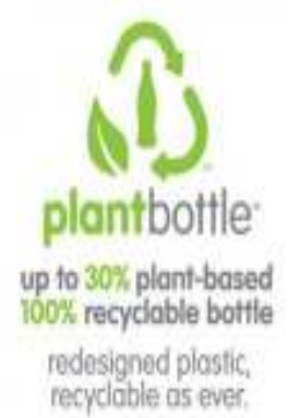
“made from plants”