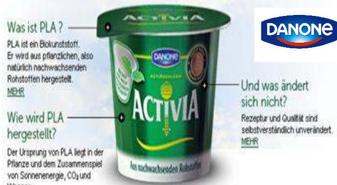
“made from renewable materials”