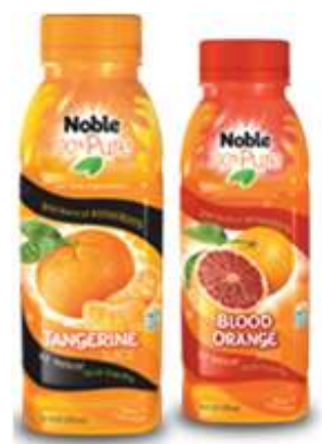
“made from all-natural renewable resources”